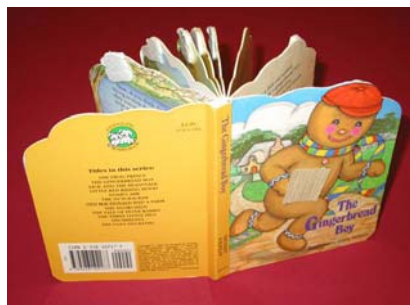
Un ejemplo de un libro que ha sido adaptado usando los maní de empaquedura como separadores de páginas.

Los separadores de paginas deberán ser puestos en la parte de arriba de la primera pagina, un poco mas abajo para la segunda pagina, mas abajo en la tercera, y así sucesivamente. Cuando usted trate de agarrar la parte baja de la página usted empezara de nuevo desde el principio en la parte de arriba de la página.